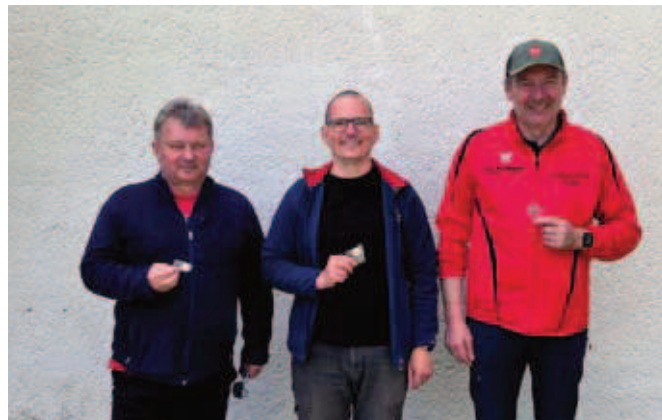
Die Sieger der VM vom 17. Mai 2026

Die Vereinsmeisterschaft Ordonnanzgewehr Auflage 15 Schuss war dann am 30. Mai 2026.