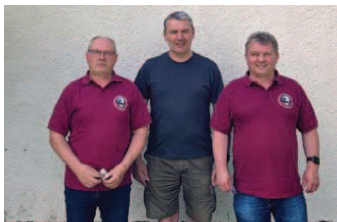
Die Sieger der VM vom 30. Mai 2026

Vom 1. bis 7. Juni 2026 war die Kreismeisterschaft – KK-Disziplinen in Lucka.