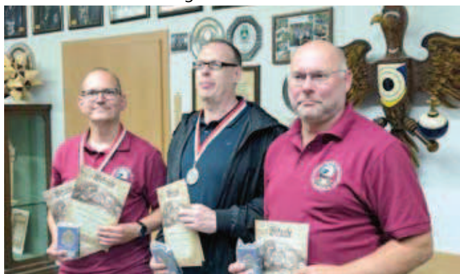
3. Platz bei Thüringer Landesmeisterschaft VL in Jena