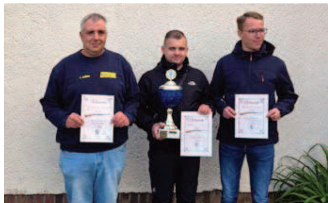
„Schießen der Vereine“ – Feuerwehr Haselbach belegt Platz 1

Am 16. Mai 2026 fand das diesjährige „Schießen der Vereine“ statt. Die Teilnahme von 14 Mannschaften war ein voller Erfolg und zeigt uns, dass dieses Angebot gern angenommen wird.