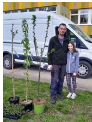
Das Team der Landschule Pleißenaue Treben

Wir möchten uns auf diesem Weg ganz herzlich bei der Gärtnerei Staacke für die großzügige Unterstützung und die Verbundenheit mit unserer Schule bedanken. Dank Ihnen werden wir unserem Namen als Landschule nun auch im Außenbereich noch ein Stück mehr gerecht. Wir freuen uns darauf, zuzusehen, wie unsere neuen Pflanzen – genau wie unsere Schüler – wachsen und gedeihen!