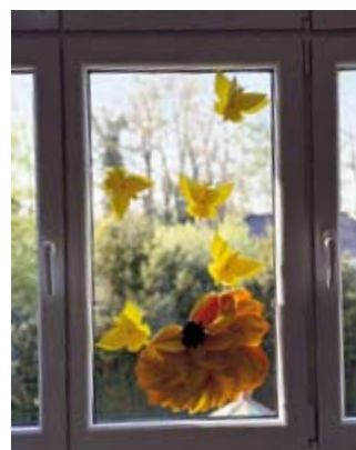
Projekt „Kraft des Papiers“s

In den Klassenzimmern präsentierten die Schülerinnen und Schüler stolz ihre Arbeiten: Von spannenden Experimenten über beeindruckende Kunstwerke bis hin zu fantasievollen Geschichten und vielfältigen Projekten gab es viel zu entdecken.