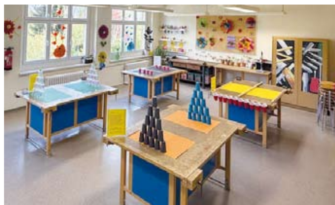
Unser Werkraum als umfunktionsiertes Spieleparadies

In den Klassenzimmern präsentierten die Schülerinnen und Schüler stolz ihre Arbeiten: Von spannenden Experimenten über beeindruckende Kunstwerke bis hin zu fantasievollen Geschichten und vielfältigen Projekten gab es viel zu entdecken.